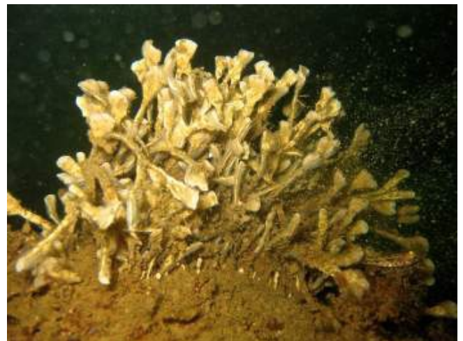
Abb. 2: Strandkrabbe auf Beutefang in einer Miesmuschelbank (links) und eine Kolonie von Blättermoostierchen (rechts), die ähnliche Wuchsformen wie Rotalgen dieser Tiefenbereiche annehmen.

Aktuell steht das Bewertungsverfahren MarBIT ( M arine B iotic I ndex T ool) zur Bewertung der benthischen wirbellosen Fauna der Ostsee zur Verfügung.