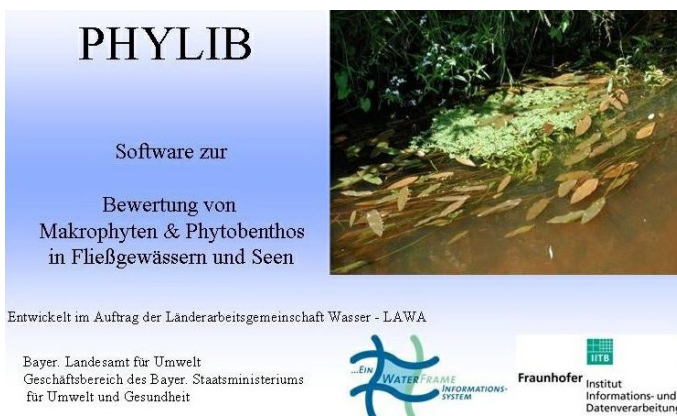
Abb. 1: Startseite von PHYLIB.

Eine weitere Voraussetzung ist die Installation der Software Java - Runtime. Hier muss mindestens Java Version 7 installiert sein. Sollte die entsprechende Java-Version nicht installiert sein, so lässt sie sich kostenlos aus dem Internet herunterladen (unter http://www.java.com ).