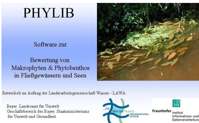
Abb. 1: Startseite von PHYLIB.

Eine weitere Voraussetzung ist die Installation der Software Java - Runtime. Hier muss mindestens Java Version 7 installiert sein. Sollte die entsprechende Java-Version nicht installiert sein, so lässt sie sich kostenlos aus dem Internet herunterladen (unter http://www.java.com ).