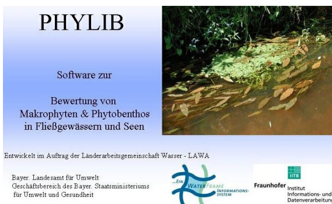
Abb. 1: Startseite von PHYLIB.

Eine weitere Voraussetzung ist die Installation der Software Java - Runtime. Hier muss mindestens Java Version 7 installiert sein. Sollte die entsprechende Java-Version nicht installiert sein, so lässt sie sich kostenlos aus dem Internet herunterladen (unter http://www.java.com ).