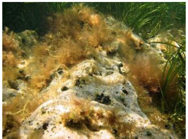
Abb. 1: Hartbodenvegetation bestehend aus dem Sägetang Fucus serratus , dem Schwarzen Gabeltang Furcellaria lumbricalis und verschiedenen Rotalgenarten auf Steingrund (links) und rote braune Feinalgen auf einer Mergel-/Miesmuschelbank (rechts).

Bei Weichbodenvegetation handelt es sich in erster Linie um höhere Pflanzen (Angiospermen) wie dem Gemeinen Seegras Zostera marina (Abb. 2). Armleuchteralgen (= Charophyten), eine speziell an den Weichboden angepassten Gruppe der Großalgen siedelt ebenfalls auf Weichboden, aber nur in sehr geschützten Bereichen mit reduziertem Salzgehalt. Vorzugsweise werden Sandgründe besiedelt, während reine Schlick- oder Kiesgründe nur vereinzelt, von ganz bestimmten Pflanzenarten oder -gruppen bewachsen werden.