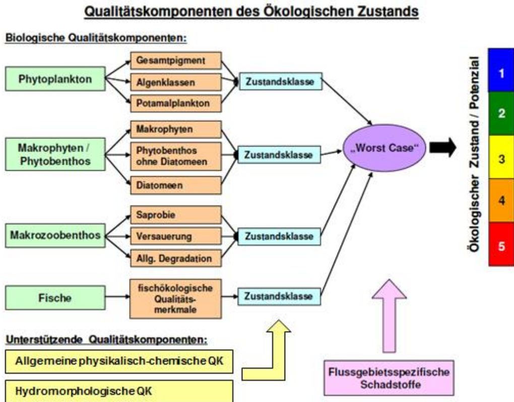
Abbildung 2: Qualitätskomponenten des ökologischen Zustands und schematische Darstellung der Bewertung nach WRRL (2000/60/EG) am Beispiel der Bewertung von Fließgewässern.

Bei der abschließenden Gesamtbewertung des ökologischen Zustands/Potenzials ist die Einhaltung der Umweltqualitätsnormen der flussgebietsspezifischen Schadstoffe nach Anlage 6 OGewV mit zu berücksichtigen. Wird eine der 67 Umweltqualitätsnormen nicht eingehalten, kann der ökologische Zustand/Potenzial höchstens mäßig sein.