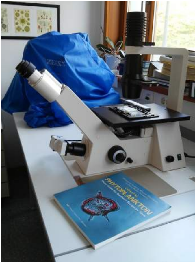
Abb. 2: Inversmikroskop.