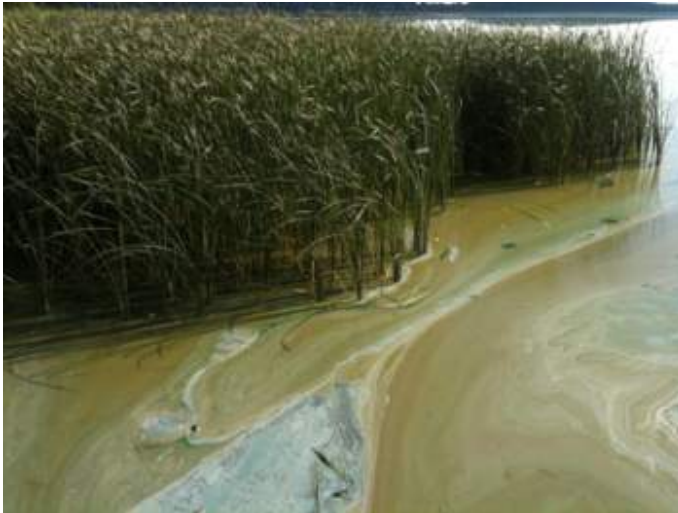
Abb. 2: Algenblüte im Blankensee.

Das Ausmaß der pflanzlichen Primärproduktion wird als Trophie bezeichnet. Je höher der Nährstoffgehalt, desto höher die Trophie und die möglichen Phytoplanktonbiomassen. Die durch den Menschen verursachte Nährstoffanreicherung in Gewässern wird als Eutrophierung bezeichnet. Stark eutrophierte Gewässer können unerwünschte Algenmassenentwicklungen ausbilden. Wenn diese durch Blaualgen gebildet werden (s. Abb. 2), wie es z. B. im Spätsommer der Fall sein kann, können Probleme durch Algengifte (Blaualgentoxine) auftreten.