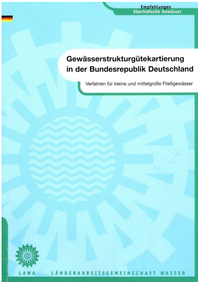
Abb. 1: Verfahrensempfehlung zur Gewässerstrukturgütekartierung in der Bundesrepublik Deutschland – Verfahren für kleinen bis mittelgroße Fließgewässer.

Die beiden Verfahren sind ursprünglich für natürliche Fließgewässer entwickelt worden. Da es in Bezug auf die Gewässerstruktur aber häufig keine Unterschiede zwischen morphologisch stark veränderten natürlichen Bächen und Flüssen oder künstlich geschaffenen Gewässern gibt, kann es auch an erheblich veränderten oder künstlichen Fließgewässern (z. B. Gräben und kleinen Kanälen) angewendet werden. Das Verfahren ist sowohl in der Landschaft als auch in Ortslagen anwendbar.